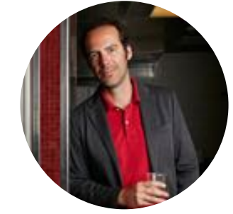
Ministry of French Food - 44K abonnés