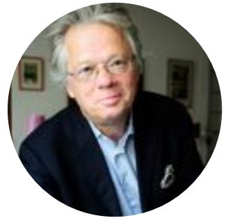
Gilles Pudlowski 102K abonnés