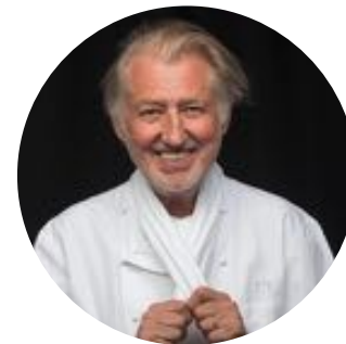
Pierre Gagnaire Chef 3 étoiles