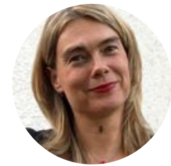
Envie d'Apéro 21K abonnés