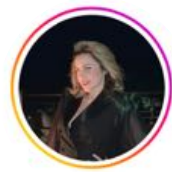
Belaz Spots 40,1K abonnés