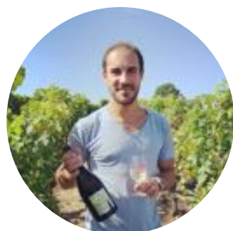
Sipmygrape 40,5K abonnés