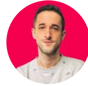
Le Paris d'Alexis 213K abonnés