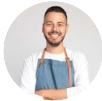
Florian On Air 141K abonnés